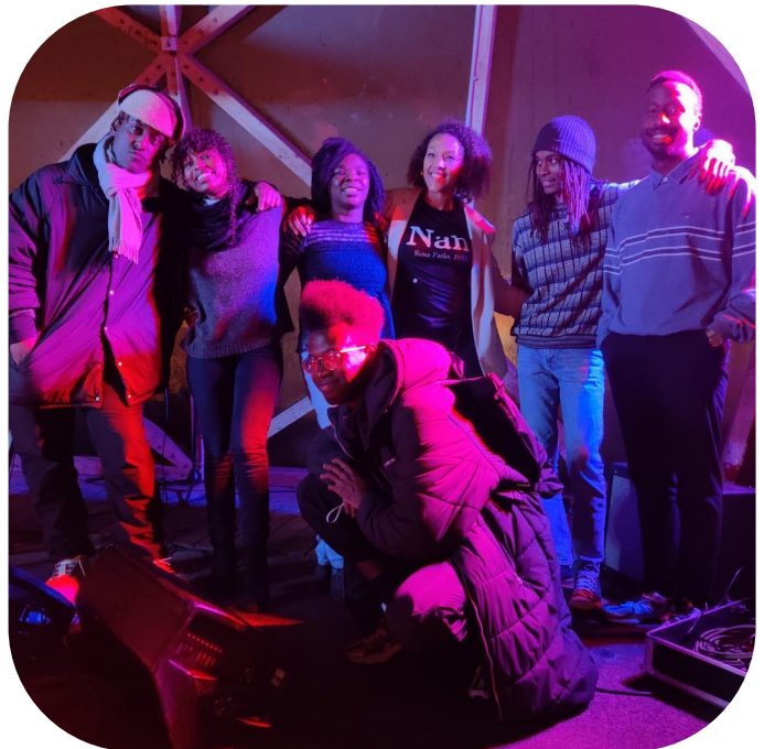
TAL UD's første event fra Menneskerettighedsdagen i Aarhus den 10. december 2021. Her er teamet foreviaget i Domen

Teamet er også vokset, og det er blevet klart efter vores første event blev afholdt sidst på året under en coronanedlukning, at vores værdier og mission deles vidt og bredt af mange.